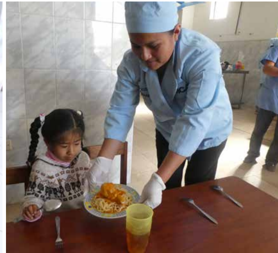
Mädchen mit warmer Tagesmahlzeit

► Gott hat Regen geschenkt. Er hat die Saat aufgehen lassen. Keine Dürre, kein Krieg, keine Überschwemmung und kein Ungeziefer hat die Ernte zerstört. Im kommenden Jahr müssen wir keinen Hunger leiden.