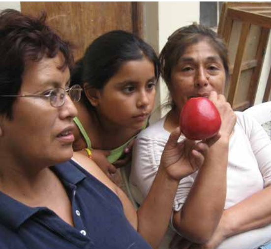
Frauen bei einem Workshop über Ernährung

Wie ein Projekt von Aktion Hoffnungszeichen benachteiligten Familien hilft