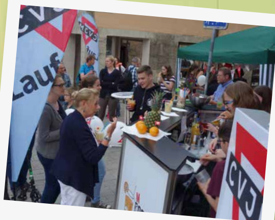
Der CVJM Lauf warb mit einem Straßenfest für die Angebote des CVJM