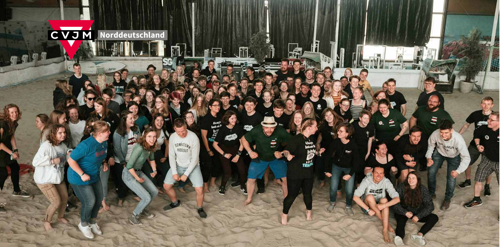
Teilnehmende des Nordivals