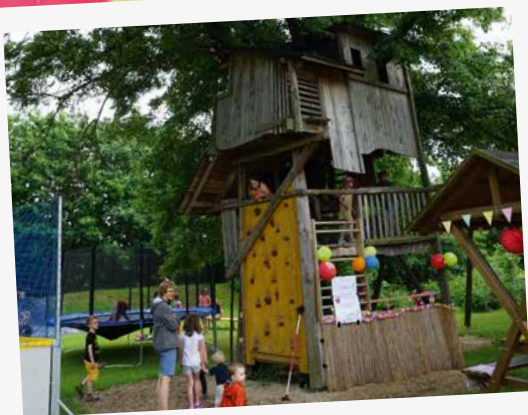
Der CVJM Joel feierte mit einem bunten Kinderfest mit zahlreichen Sportangeboten den CVJM-Geburtstag