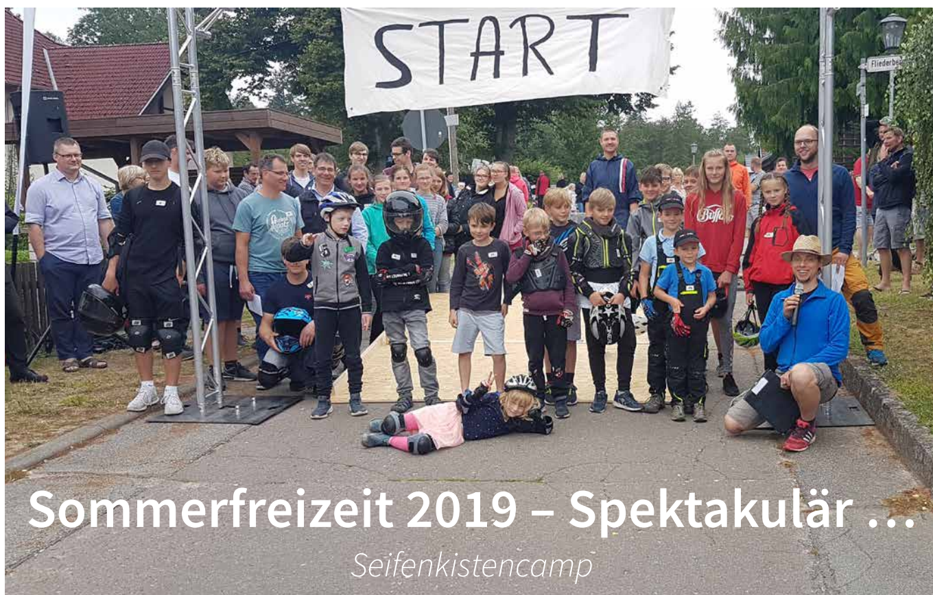
Teilnehmer und Teamer des Seifenkistencamps

► In Mecklenburg – Vorpommern sind seit einer Woche Sommerferien. Für die meisten Schüler wohl die schönste Zeit des Jahres, man verbringt Zeit mit der Familie oder mit Freunden und darf auch ab und zu einfach mal gar nichts tun. Doch gerade daran gewöhnt, liegt die Aufregung für die zweite Ferienwoche schon in der Luft. 16 Jugendliche und 6 motivierte Teamer treffen sich Sonntagnachmittag in Slate bei Parchim zur Sommerfreizeit des CVJM Brückenschlag Nord-Ost e. V.