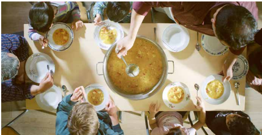
Kinder bekommen warme Mahlzeit in OT-Arbeit des CVJM Halle

Über die Versorgung mit dem Nötigsten und einen verantwortlichen Umgang mit Lebensmitteln