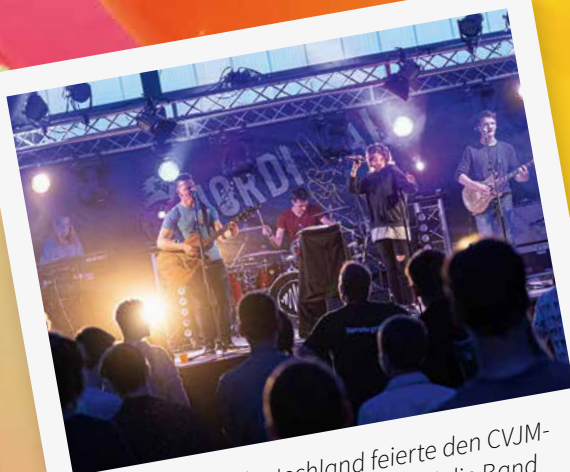
Der CVJM Norddeutschland feierte den CVJM-Geburtstag beim Nordival. Im Bild die Band Beatween