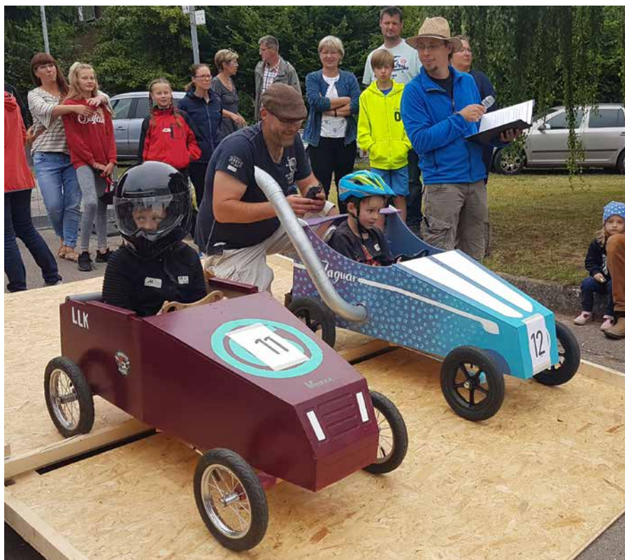
Bild unten links: Zwei Seifenkisten am Start Bild unten rechts: Zum Programm gehörte auch Kistenklettern