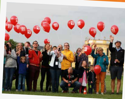
In Kassel feierten die CVJM-Ortsvereine gemeinsam mit dem CVJM Deutschland und der CVJM-Hochschule in der Karlsaue mitten in der Stadt

► Am 6. Juni war es endlich so weit: Der CVJM erinnerte sich an seine Gründung vor 175 Jahren. In Deutschland wurde das Jubiläum an vielen Orten und mit ganz verschiedenen Partys gefeiert. Hier erhaltet ihr einen kleinen Eindruck von den Feierlichkeiten.