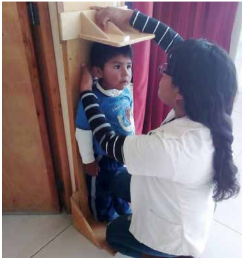
Junge bei der Wachstumskontrolle